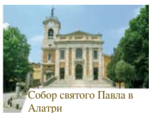
Собор святого Павла в Алатри