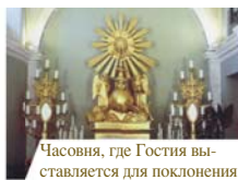
Часовня, где Гостия выставляется для поклонения