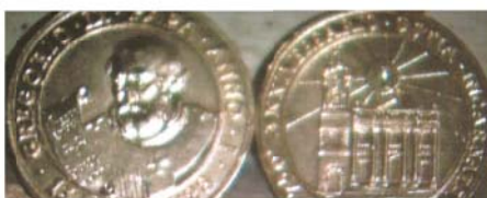
В 1978 году торжественно отмечалась 750-я годовщина чуда. По этому случаю была отчеканена медаль, на лицевой стороне которой изображен папа Григорий IX с буллой, а на оборотной – собор с Гостией над ним