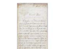
Письмо настоятеля Санта-Мария-алле-Терме от 22 марта 1888 года, в котором он благодарит за дарованную частицу Гостии из Алатри