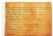
Буллы папы Григория IX Fratemitas Tuae