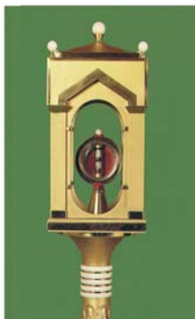
Дароносица с чудесной реликвией