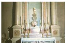
Часовня внутри собора, где хранится ковчег с чудесной реликвией