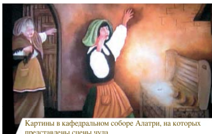
Картины в кафедральном соборе Алатри, на которых представлены сцены чуда