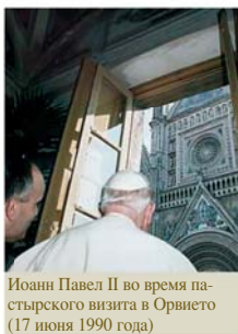
Иоанн Павел II во время папского визита в Орвието (17 июня 1990 года)