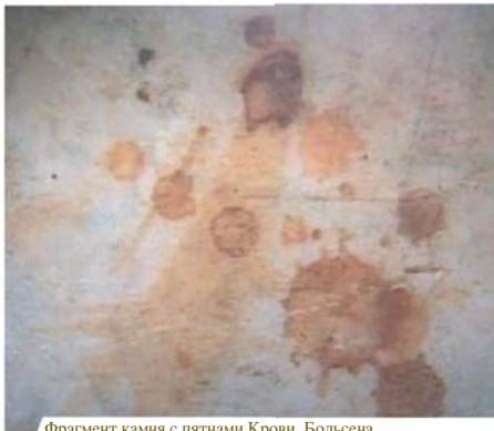
Фрагмент камня с пятнами Крови, Больсена