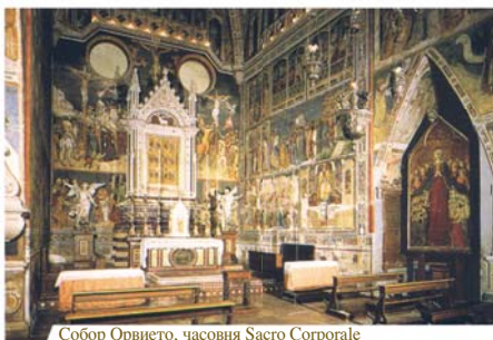
Собор Орвието, часовня Sacro Corporale

«Внезапно Гостия видимым образом превратилась в окровавленную Плоть...»