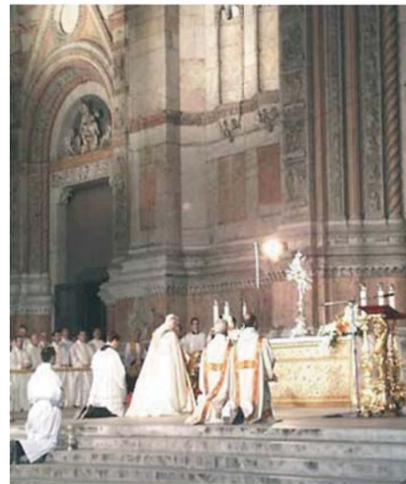
Поклонение Святым Дарам в торжество Corpus Domini, Орвието