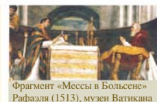
Фрагмент «Мессы в Больсене» Рафаэля (1513), музеи Ватикана