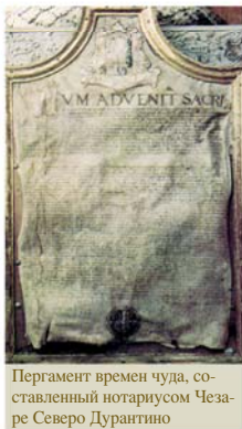
Пергамент времен чуда, составленный нотариусом Чезаре Северо Дурантино