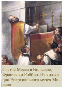
Святая Месса в Больсене, Франческо Роббио. Из коллекции Епархиального музея Милана

«Внезапно Гостия видимым образом превратилась в окровавленную Плоть...»