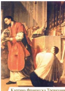
Картина Франческо Тревизани