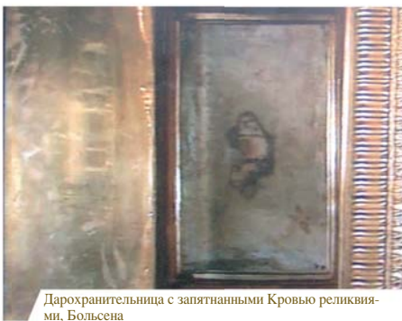
Дарохранильница с запятыми Кровью реликвиями, Больсена