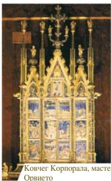
Ковчег Корпорала, мастерская Уголино ди Вieri (1338), Орвието