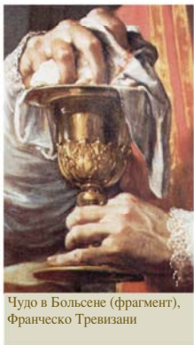
Чудо в Больсене (фрагмент), Франческо Тревизани