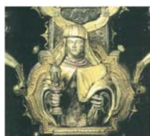
Святая Клара. Деталь большого креста Джанфранческо далле Крочи