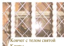
Ковчег с телом святой Клары