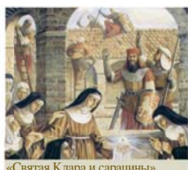
«Святая Клара и сарацины», Пьеро Казентини. Монастырь Святого Креста, Pignataro Maggiore