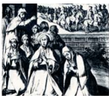
Энрико де Врум (1587), «Чудо святой Клары»