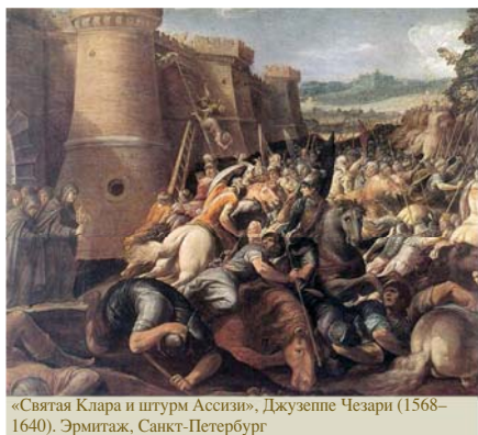
«Святая Клара и штурм Ассизи», Джузеппе Чезари (1568–1640). Эрмитаж, Санкт-Петербург