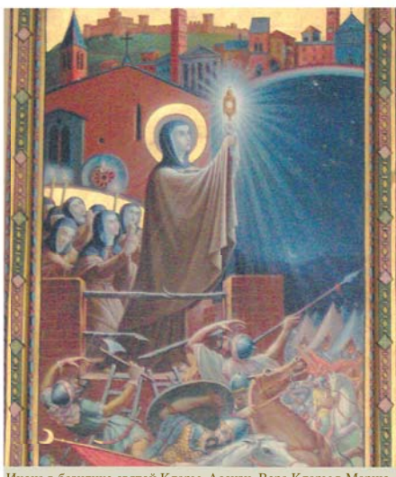
Икона в базилике святой Клары, Ассизи. Вера Клары в Марию и Ее Сына, пребывающего в бедности евхаристического Хлеба, превозмогла вражью силу.

«Сказание о святой Кларе, деве» повествует о многих чудесах, совершенных св. Кларой. В нем есть рассказ об умножении хлебов и бутылей с маслом, когда в монастыре закончилась пища. Но самое известное свое чудо Клара совершила в сентябре 1240 года, в пятницу, когда в монастырскую обитель ворвались сарацины и Клара отразила атаку, явив врагам освященную Гостию.