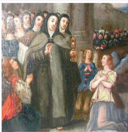
Старинное изображение чуда святой Клары