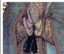
Пояс, расположенный выше пупка, означает беременность Пресвятой Девы. У индейцев нахуатль этот пояс является символом окончания цикла и рождения новой эры. В образе Пресвятой Девы Гваделупской он символизирует наступление эры Иисуса Христа и в Старом, и в Новом Свете.

Бесспорное историческое основание Евхаристии – это воплощение Сына Божьего. «Плоть Христа, плоть Марии», – говорит святой Августин. Церковь «с радостью созерцает в лице Марии, как в чистейшем образе, то, чем она сама желает и надеется быть в своей целостности» (SC, 103): дарохранительницу, материнское лоно, дароносицу. Пресвятая Дева явилась в Гваделупе облаченной в одеяние, плотно перетянутое черным поясом, какое в тех краях носят беременные женщины.