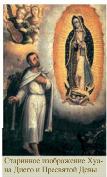
Старинное изображение Хуана Диего и Пресвятой Девы