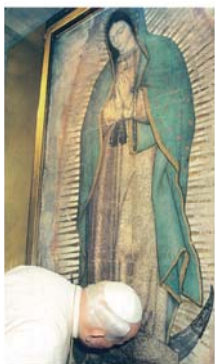
Папа Иоанн Павел II в паломничестве к Пресвятой Деве Гваделупской (6 мая 1999 года)