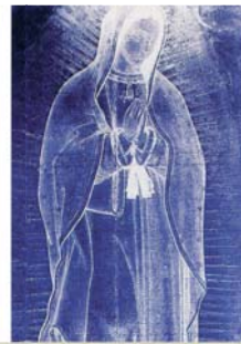
Образ Пресвятой Девы Гваделупской. Как показал инфракрасный анализ, выполненный учеными Дж.Б. Смитом и П.С. Каллаханом, образ, подобно Туринской Плащанице, не является рукотворным. Заключение гласит: «Происхождение образа в Гваделупе необъяснимо».