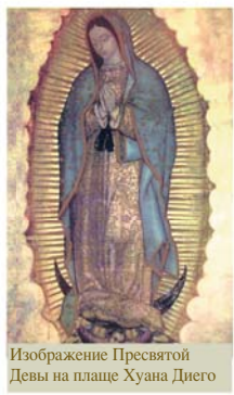
Изображение Пресвятой Девы на плаще Хуана Диего