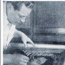
Калос Саслина и ученый Тонсманн обнаружили в радужной оболочке глаз Девы Гваделупской изображение людей, присутствовавших при появлении Хуана Диего