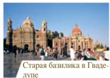
Старая базилика в Гваделупе