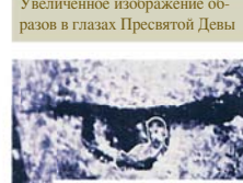
Здесь было замечено отражение лица Хуана Диего