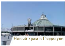
Новый храм в Гваделупе