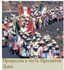
Процессия в честь Пресвятой Девы