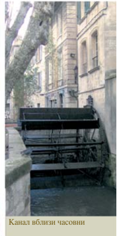
Канал вблизи часовни