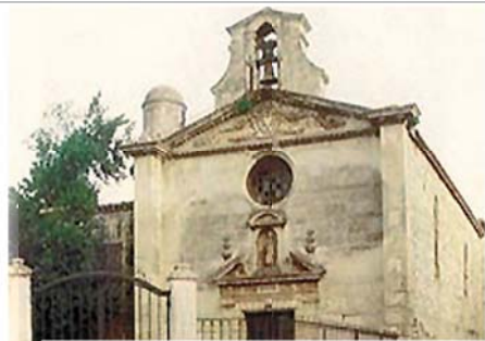
Фасад часовни Серых кающихся грешников