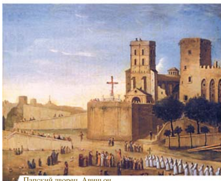
Папский дворец, Авиньон