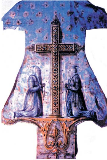
Мантия Серых кающихся грешников