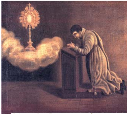
Габриэль де Видо Латур, первый глава Серых грешников