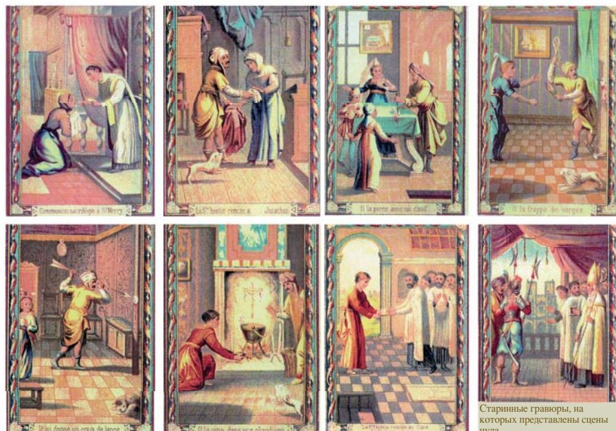
Старинные гравюры, на которых представлены сцены чуда