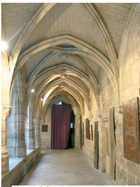
Монастырь Де-Бийет, ныне протестантская церковь

В отчаянии он бросил Гостию в кипяток, но она поднялась из воды и повисла в воздухе, приняв форму распятия.