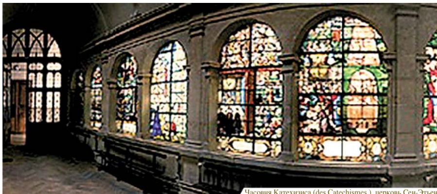
Часовня Катехизиса (des Catechismes.), церковь Сен-Этьен

В отчаянии он бросил Гостию в кипяток, но она поднялась из воды и повисла в воздухе, приняв форму распятия.