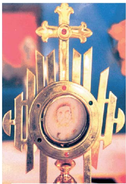
Дароносица с Гостией, на которой появился образ Иисуса