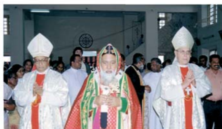
Его высокопреосвященство Сирил Мар Базелис, архиепископ епархии Тривандрум

Это евхаристическое чудо случилось совсем недавно, 5 мая 2001 года, в Тривандрум, Индия. На Гостии появился лик Христа, увенчанного терниями. Его высокопреосвященство Сирил Мар Базелис, архиепископ епархии Тривандрум, писал об этом чуде: «Мы, христиане, узрели именно то, во что всегда верили... Если Господь говорит с нами через этот знак, значит, с нашей стороны должен непременно последовать ответ». Дароносица с чудесной Гостией сейчас хранится в той же церкви.