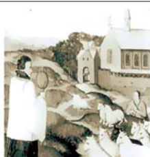
На картине из собора в Хассельте стадо в местечке Сакраментсберг почтительно склоняется, когда священник пронесит мимо святыню реликвию.