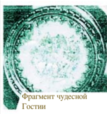
Фрагмент чудесной Гостии