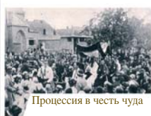
Процессия в честь чуда