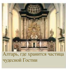
Алтарь, где хранится частица чудесной Гостии