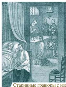
Старинные гравюры с изображением чуда