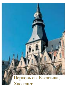
Церковь св. Квентина, Хассельт