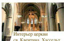
Ингерьер церкви св. Квентина, Хассельт