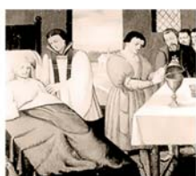
Картины Яна ван Букхорста, изображающие чудесные события; собор Хассельта