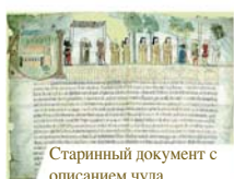
Старинный документ с описанием чуда