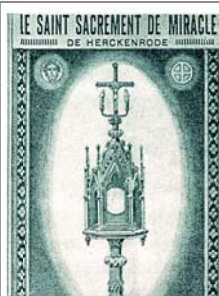
Дароносица, в которой чудесная Гостия находится во время процессий