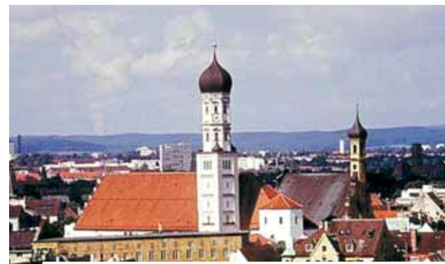
Convento de Heilig Kreuz, Augsbug