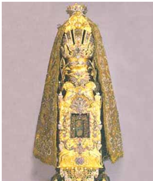
Relicário que contém a Hóstia do Prodígio conhecida como Wunderbarlichen Gutes

O Milagre Eucarístico de Augusburg, conhecido pelos moradores como “ Wunderbarlichen Gutes – Bem Milagroso ”, é descrito em numerosos livros e documentos históricos que podem ser consultados na biblioteca estadual e civil de Augsbug. Uma Hóstia roubada transformou-se em carne ensangüentada. Com o passar dos anos foram realizadas diversas análises na Partícula que confirmaram sempre que se trata de carne e sangue humanos. Hoje o Convento de Heilig Kreuz é custodiado pelos padres dominicanos.