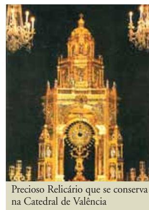
Precioso Relicário que se conserva na Catedral de Valência