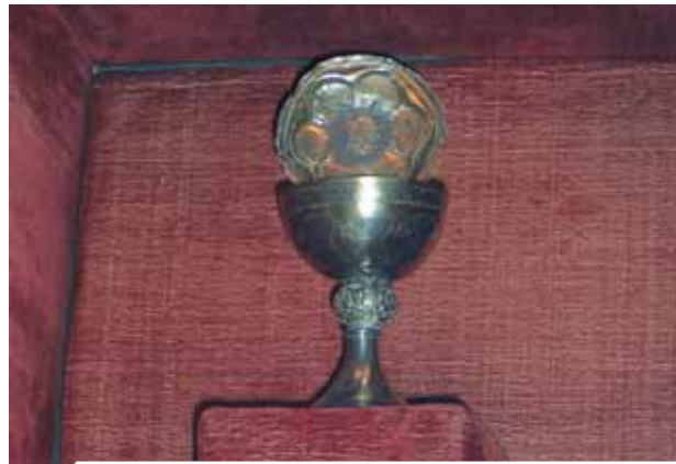
Relíquia do Cálice, da Patena e do Santo Sangue do Milagre

No Milagre Eucarístico de O'ebreiro, durante a Missa, a Hóstia converteu-se em Carne e o vinho em Sangue, que saiu do cálice manchando o corporal. O Senhor realizou este Prodígio para sustentar a pouca fé do sacerdote que não acreditava na presença real de Jesus na Eucaristia. As Sagradas Relíquias do Milagre estão ainda hoje guardadas na Igreja onde acontece o Prodígio e são numerosos os peregrinos que todos os anos acorrem para venerá-lo.