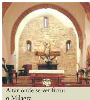
Altar onde se verificou o Milagre