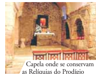
Capela onde se conservam as Relíquias do Prodígio