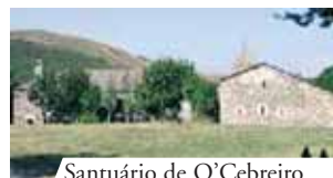
Santuário de O'ebreiro