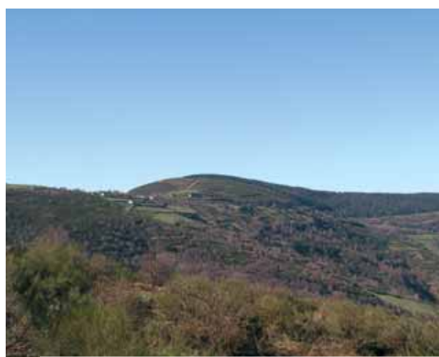
Vista panorâmica do Mosteiro de O'ebreiro