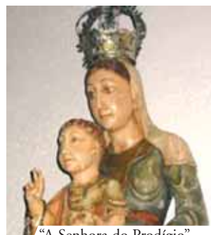
"A Senhora do Prodígio"