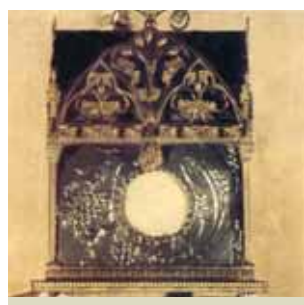
Custódia da Pedra do Milagre, Paróquia de S. Bernardino