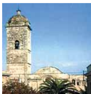
Paróquia de S. Bernardino, Mogoro