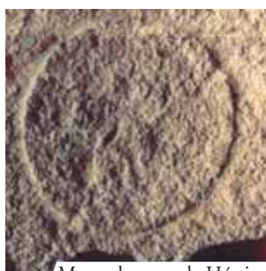
Marca da segunda Hóstia