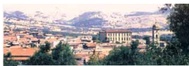
Vista de Mogoro