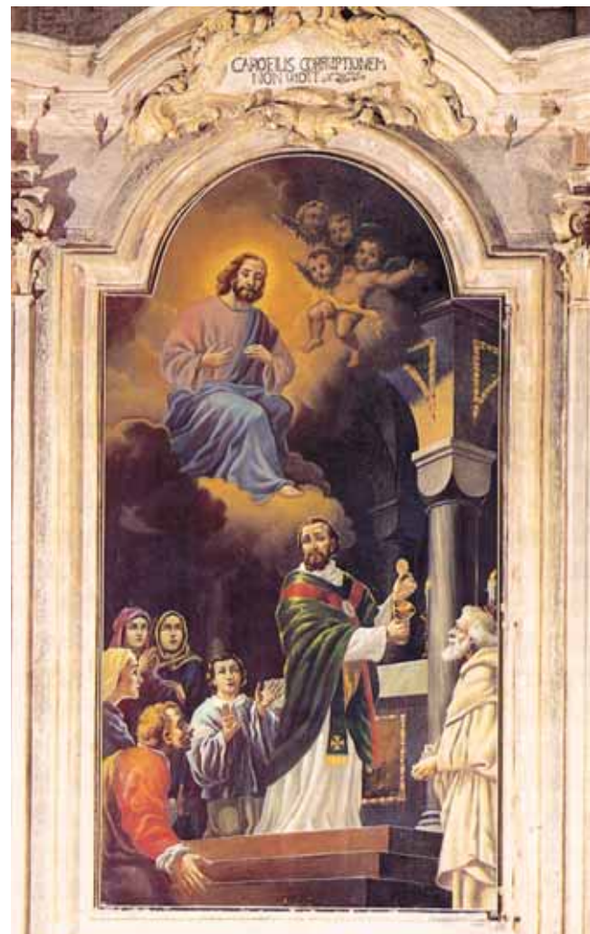
Pintura presente na Capela Valsecca que representa o Milagre.