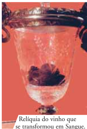
Relíquia do vinho que se transformou em Sangue.