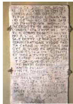
Lápide de 1631 que descreve o Milagre.