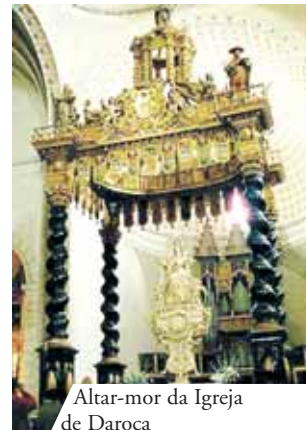
Altar-mor da Igreja de Daroca