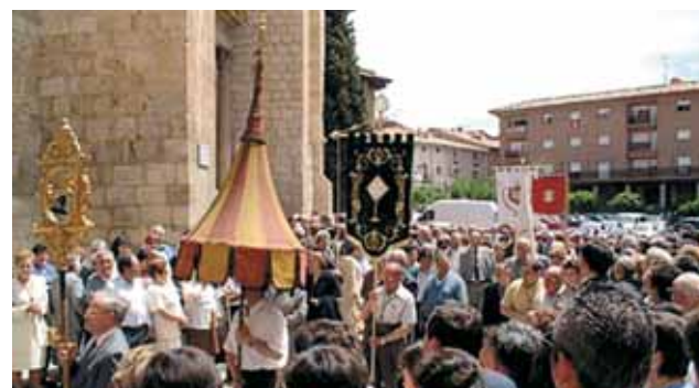
Procissão que se faz todos os anos em honra do Milagre de Daroca