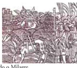
Estampas antigas representando o Milagre