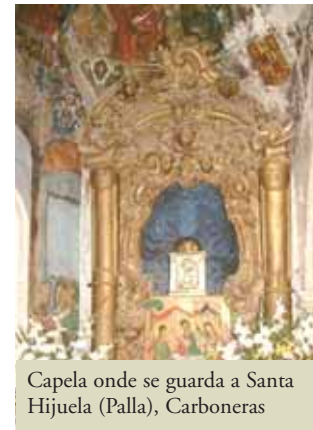
Capela onde se guarda a Santa Hijuela (Palla), Carboneras