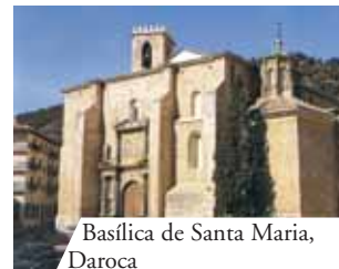
Basilica de Santa Maria, Daroca