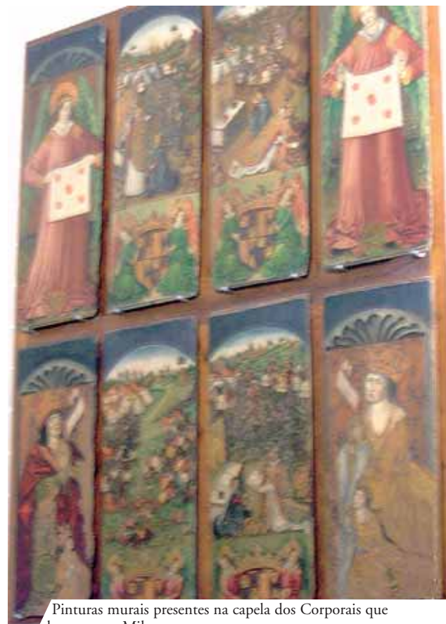
Pinturas murais presentes na capela dos Corporais que descrevem o Milagre