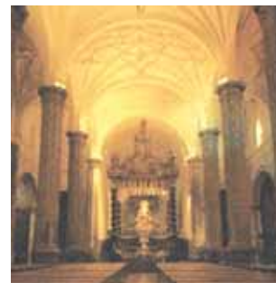
Interior da Igreja