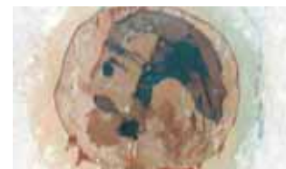
Reprodução ampliada do rosto surgido na página direita.