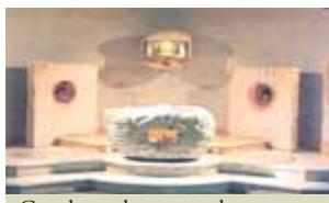
Capela onde se guarda a Relíquia na Basilica inferior.