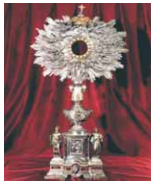
Antigo Relicário que continha a Relíquia do Milagre.