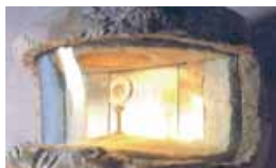
Tabernáculo do Milagre Eucarístico.