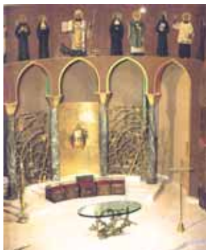
Basilica superior com presbitério (capela-mor) do escultor Manzù.