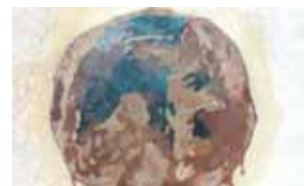
Reprodução ampliada do rosto surgido na página esquerda.