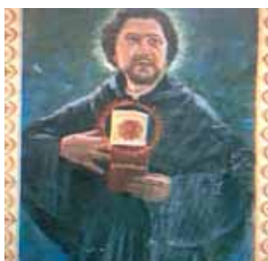
BEATO SIMONE DI CASCIA