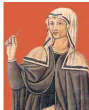
A mais antiga representação de Santa Rita.