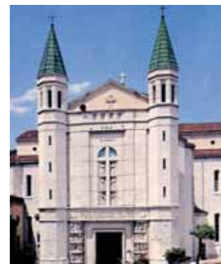
Basilica de Santa Rita.

Em Cascia, na Basilica dedicada a Santa Rita, conserva-se também a Relíquia de um notável Milagre Eucarístico, que aconteceu próximo de Siena no ano de 1330. A um sacerdote foi pedido que levasse a Comunhão a um camponês enfermo. O padre, pega numa Partícula consagrada, enfia-a irreverentemente entre as páginas do seu breviário e dirige-se a casa do camponês. Chegado a casa do doente e depois de tê-lo confessado, abre o livro para pegar a Hóstia que lá tinha colocado, mas para sua grande surpresa constata que a Partícula estava tingida de sangue vivo, tanto, que impregnara ambas as páginas entre as quais havia sido posta. O sacerdote confuso e arrependido recolheu-se imediatamente em Siena no Convento agostiniano para pedir conselho ao Padre Simone Fidate de Cascia, conhecido de todos por ser um santo homem.