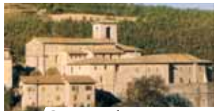
Convento de S. Agostinho em Cascia.

Em 1330, em Cascia, um camponês gravemente doente mandou chamar o padre para receber a Comunhão. O sacerdote, um pouco por incúria e um pouco por apatia, em vez de levar consigo o cibório para lá colocar a Partícula e a levar a casa do doente, tirou deste uma Hóstia que enfiou irreverentemente no livro de orações. Uma vez junto ao camponês, o sacerdote abre o livro e, com espanto, vê que a Hóstia estava transformada num coágulo de sangue que tinha manchado também as páginas do livro.