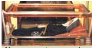
Urna que contém o corpo de S. Rita que se conserva intacto.