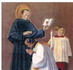
Pintura que representa o Beato Simone Fidati.