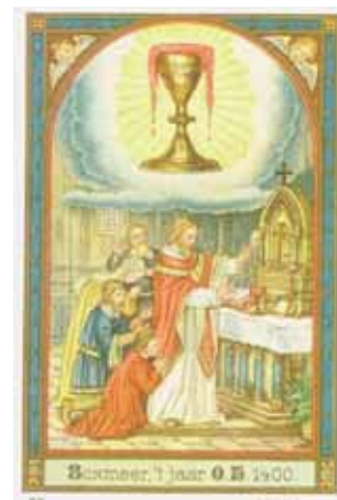
Boxmeer, 7 Jaar 0 B 1400