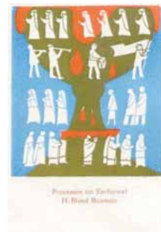
Procèsus van Eucharistie H Bloed Boxmeer