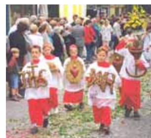
Procissão em honra do Prodígio

Pontífices, Clemente XI, Bento XIV, Pio IX e Leão XIII manifestaram uma particular devoção para com o Prodígio.