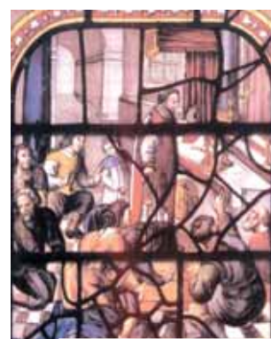
Vitral no interior da Igreja no qual está representado o Prodígio