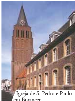
Igreja de S. Pedro e Paulo em Boxmeer

Em Boxmeer, na Holanda, no ano de 1400, as espécies do vinho transformaram-se em Sangue e saíram do cálice, espalhando-se sobre o Corporal. O padre, aterrorizado com esta visão, pede imediatamente perdão a Deus e o Sangue cessou imediatamente de sair do cálice. O Sangue que caiu sobre o Corporal coagulou, formando uma massa do tamanho de uma noz. É possível ver, ainda hoje, o Sangue que não sofreu nenhuma alteração no tempo.