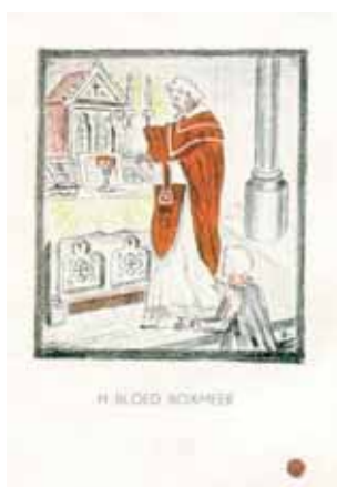
H BLOED BOXMEER