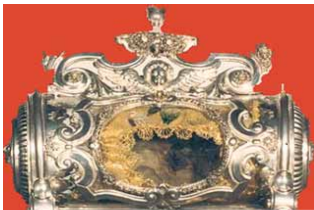
Relíquia do Sangue