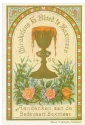
Miraculum B. Blood in Boxmeer Handenken aan de Bedevaart Boxmeer