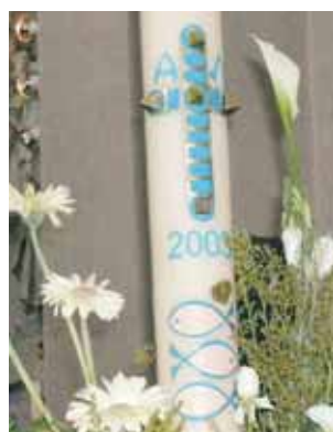
Círio comemorativo com os peixes de Alboraya-Almácer