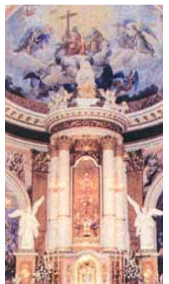
Interior da paróquia de Almácer