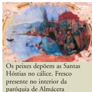
Os peixes depõem as Santas Hóstias no cálice. Fresco presente no interior da paróquia de Almácer