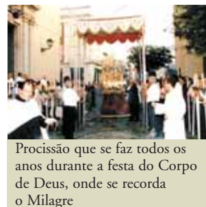
Procissão que se faz todos os anos durante a festa do Corpo de Deus, onde se recorda o Milagre