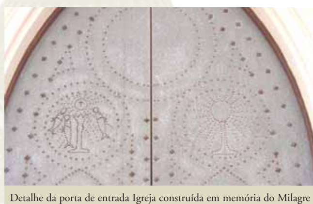
Detalhe da porta de entrada Igreja construída em memória do Milagre