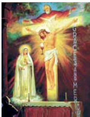
Quadro raffigurante l'apparizione che ebbe Suor Lucia in cui la Madonna le chiese di divulgare la devozione riparatrice dei primi cinque Sabati del mese