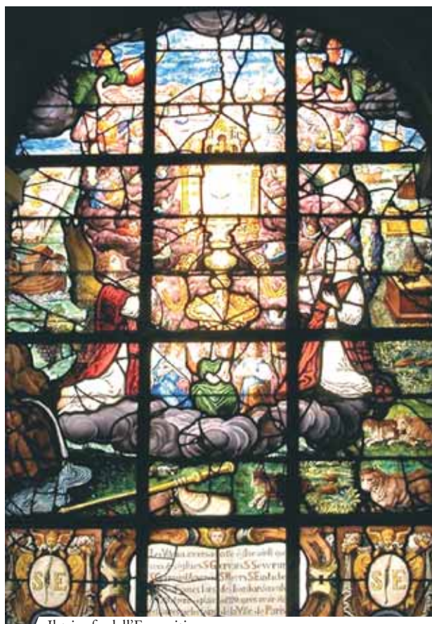
Il trionfo dell'Eucarsitia