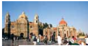
Basilica vecchia di Guadalupe