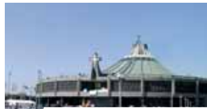
Nuovo Santuario di Guadalupe

La base storica indiscutibile dell'Eucaristia è l'Incarnazione del Figlio di Dio. «Carne di Cristo, carne di Maria», dice Sant'Agostino. La Chiesa «in Maria contempla con gioia, come in una immagine purissima, ciò che essa desidera e spera di essere nella sua interezza» (SC, 103): tabernacolo, grembo, ostensorio. La Madonna è apparsa a Guadalupe vestita con un abito fasciato alla vita da una cintura nera identica a quella indossata dalle donne gravide secondo le usanze locali.