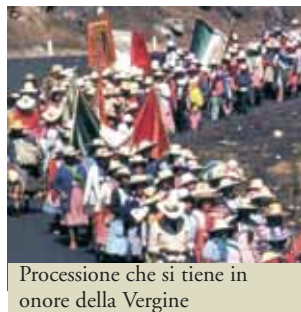
Processione che si tiene in onore della Vergine