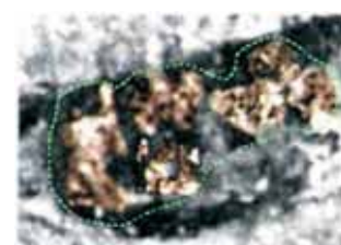
Ingrandimenti delle immagini presenti negli occhi della Vergine