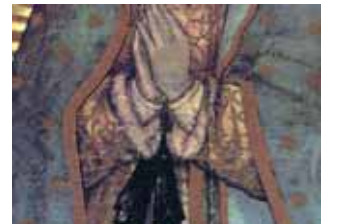
La cintura segna la gravidanza della Vergine. Si trova sopra il Ventre. La forma della cintura, nel mondo náhuatl, rappresentava la fine di un ciclo e la nascita di una nuova era. Nell'immagine della Vergine di Guadalupe simbolizza che con Gesù Cristo si inizia una nuova era tanto per il vecchio come per il nuovo mondo.