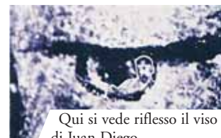
Qui si vede riflesso il viso di Juan Diego

All'alba del 9 dicembre 1531, il giovane indio Juan Diego salì sul colle del Tepeyac, alla periferia nord di Città del Messico, dirigendosi verso Tlatelolco, per la consueta lezione di catechismo. Improvvisamente udì un canto soavissimo e si diresse nel luogo da cui proveniva il suono. Giunse davanti a una giovane donna, con un abito risplendente, che gli rivelò di essere la Vergine Maria. La Madonna pregò Juan Diego di chiedere al Vescovo della capitale di far costruire un tempio su luogo dove era apparsa, affinché tutti potessero onorare il Suo Figlio Gesù. Juan Diego obbedì, ma il Vescovo, Juan de Zumárraga, non gli credette, e gli disse di domandare alla Madonna un segno. Quando la Vergine apparve per la terza volta a Juan Diego, gli promise di dargli il segno richiesto il giorno seguente. Il lunedì, però, Juan Diego non andò all'appunta-