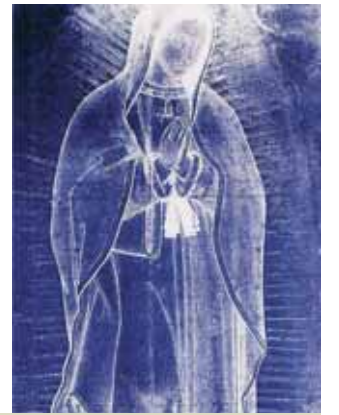
L'immagine della Vergine di Guadalupe, come la Sindone di Torino, è un'immagine non fatta da mano umana come hanno dimostrato gli scienziati J. B. Smith e P.S. Callahan che l'hanno analizzata ai raggi infrarossi. La loro conclusione fu la seguente: «L'origine dell'immagine di Guadalupe risulta inspiegabile».