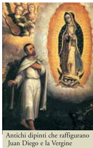
Antichi dipinti che raffigurano Juan Diego e la Vergine