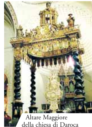
Altare Maggiore della chiesa di Daroca