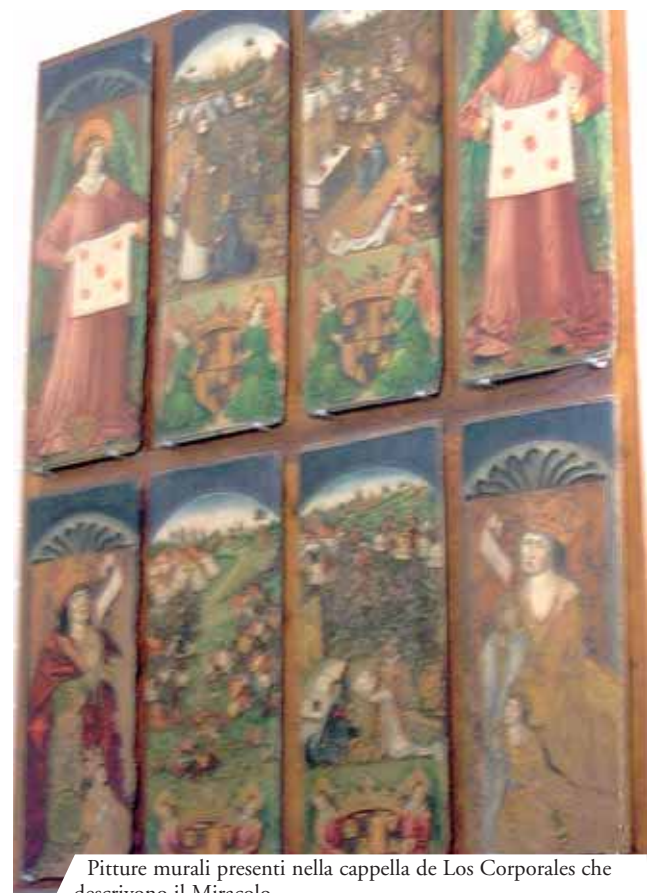
Pitture murali presenti nella cappella de Los Corporales che descrivono il Miracolo