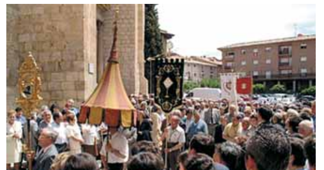
Processione che si tiene ogni anno in onore del Miracolo di Daroca