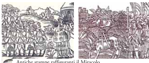
Antiche stampe raffiguranti il Miracolo