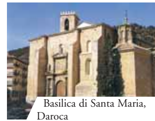
Basilica di Santa Maria, Daroca