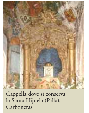
Cappella dove si conserva la Santa Hijuela (Palla), Carboneras