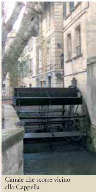
Canale che scorre vicino alla Cappella