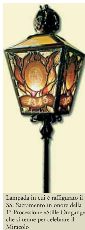
Lampada in cui è raffigurato il SS. Sacramento in onore della 1ª Processione «Stille Omgang» che si tenne per celebrare il Miracolo