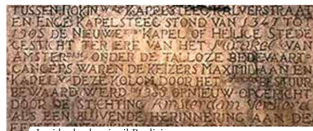
Lapide che descrive il Prodigio