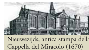
Nieuwezijds, antica stampa della Cappella del Miracolo (1670)