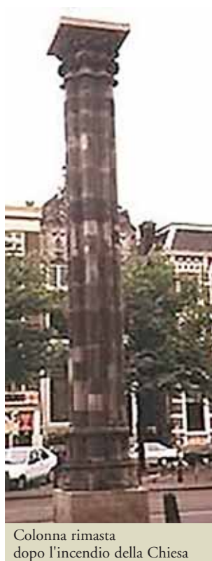
Colonna rimasta dopo l'incendio della Chiesa