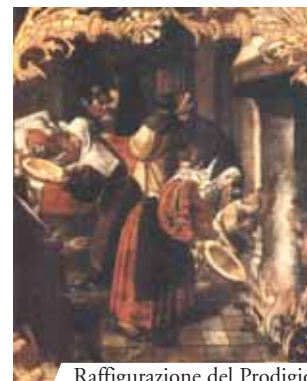
Raffigurazione del Prodigio