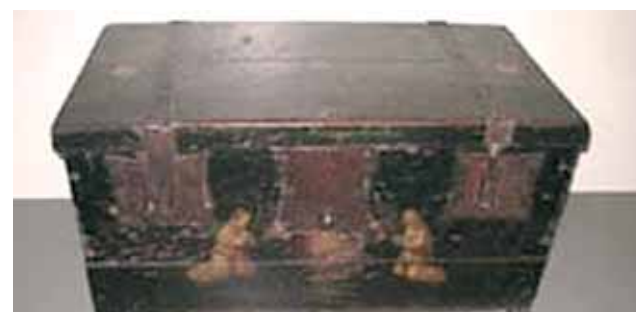
Cassetta che conteneva l'Ostia miracolosa