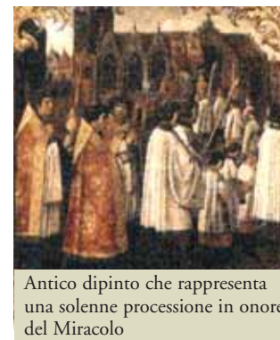
Antico dipinto che rappresenta una solenne processione in onore del Miracolo