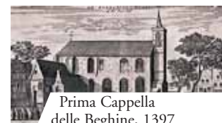
Prima Cappella delle Beghine, 1397