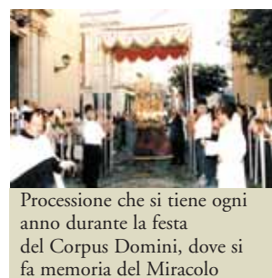
Processione che si tiene ogni anno durante la festa del Corpus Domini, dove si fa memoria del Miracolo