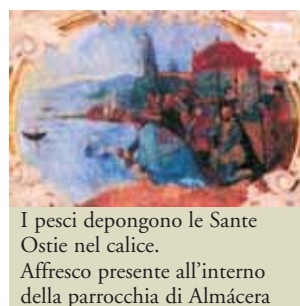
I pesci depongono le Sante Ostie nel calice. Affresco presente all'interno della parrocchia di Almácer