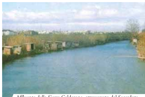
Affluente della Sierra Calderona, attraversato dal Sacerdote