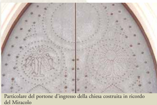
Particolare del portone d'ingresso della chiesa costruita in ricordo del Miracolo