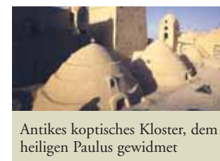
Antikes koptisches Kloster, dem heiligen Paulus gewidmet