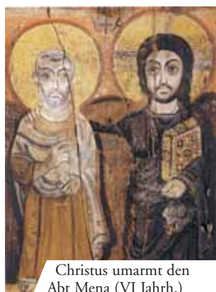
Christus umarmt den Abt Mena (VI Jahrh.)