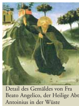
Detail des Gemäldes von Fra Beato Angelico, der Heilige Abt Antoinius in der Wüste