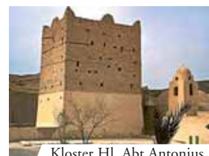
Kloster Hl. Abt Antonius