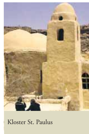
Kloster St. Paulus