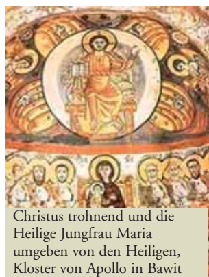
Christus thronend und die Heilige Jungfrau Maria umgeben von den Heiligen, Kloster von Apollo in Bawit