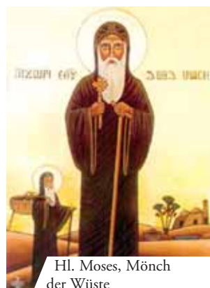
Hl. Moses, Mönch der Wüste