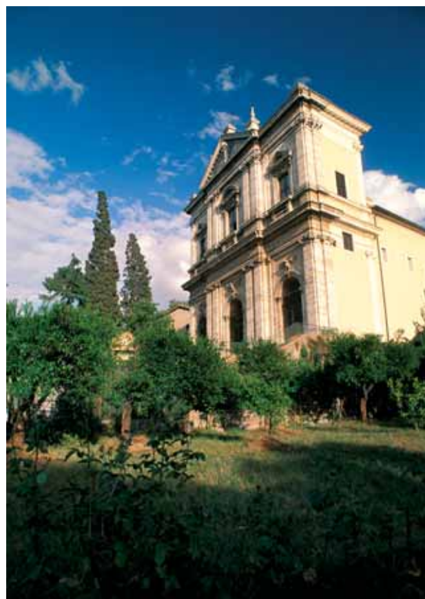
Kirche S.Gregorio Magno al Celio, Rom