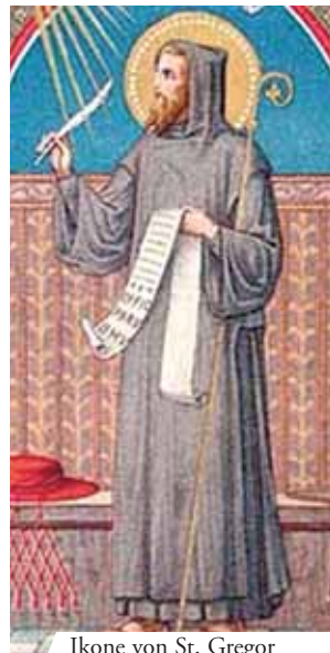
Ikone von St. Gregor