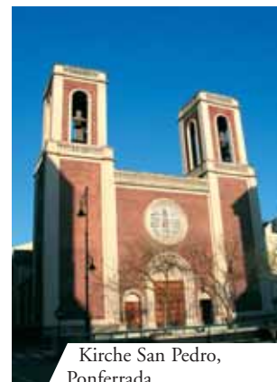
Kirche San Pedro, Ponferrada