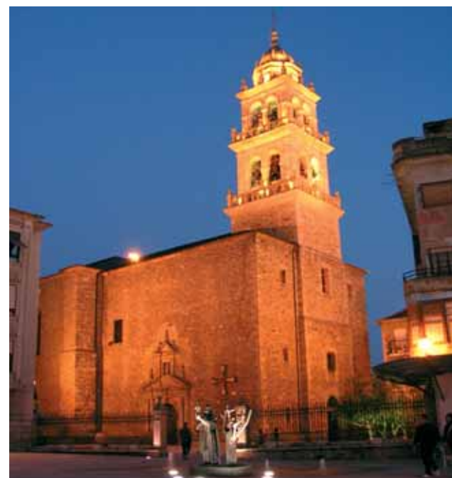
Kirche von Ponferrada, Santa Maria