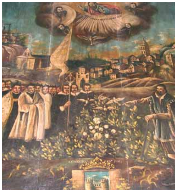
Gemälde, welches das Wunder darstellt, heute in der Kirche San Pedro