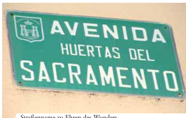
Straßenname zu Ehren des Wunders