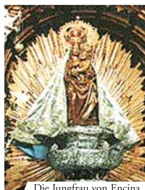
Die Jungfrau von Encina