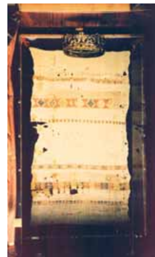
Reliquie des blutbefleckten Leinentuches