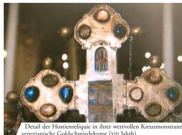
Detail der Hostienreliquie in ihrer wertvollen Kreuzmonstranz, venezianische Goldschmiedekunst (XIII Jahrh)