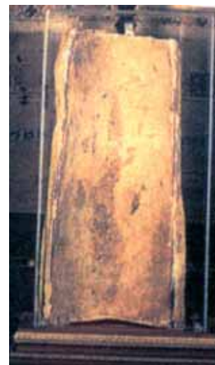
Ziegel des Wunders, Offida