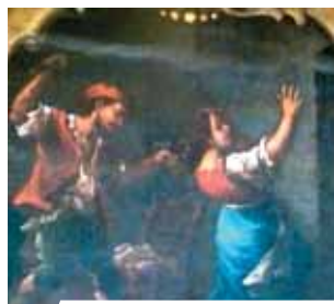
Freskenzyklus, das Wunder darstellend

In der Kirche Sant'Agostino in Offida befinden sich die Reliquien des eucharistischen Wunders, welches 1273 stattfand. Viele Dokumente berichten, wie sich eine Hostie in blutendes Fleisch verwandelte: 1788 beglaubigte der Notar Giovanni Battista Doria eine Kopie eines Pergaments des XIII Jahrhunderts, außerdem existieren mehrere Papstbulen, angefangen von der Bulle von Bonifazius VIII (1295) bis zur Bulle von Sixtus V (1585), Beiträge von Konferenzen, bischöfliche Dekrete, Votivgeschenke, Gedenksteine, Fresken und Berichte von Geschichtswissenschaftlern, wie Antinori und Fella.