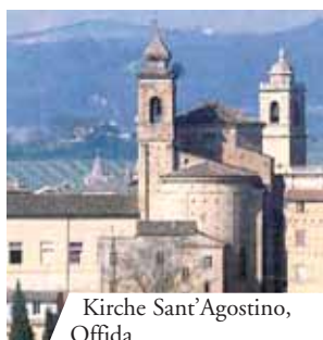
Kirche Sant'Agostino, Offida