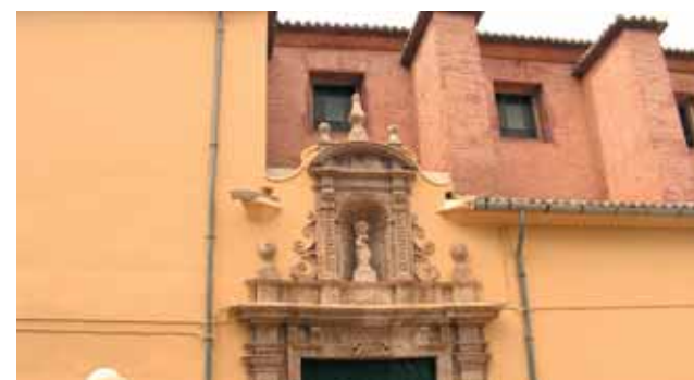
Kirche in welcher das Wunder stattfand