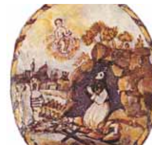
Ines in der Grotte