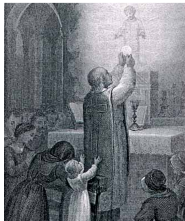
Antike Darstellung des Wunders

Die französischen Kardinäle hatten mit allen Mitteln die Wahl des Papstes Urban VI (18. April 1378) zu verhindern versucht, denn sie wollten einen französischen Papst, in der Hoffnung den Papstszitz erneut nach Avignon zu verlegen. Nach mehreren Geschehnissen wählte man am 20. September 1378 den Gegenpapst Klemens VII. Die Schismatiker versuchten daraufhin Rom mit Waffengewalt zu erobern, was ihnen aber misslang, so zogen sie sich nach Avignon zurück. Dort handelte Klemens VII weiterhin, als wäre er der legitime Papst. In jener unstillen Zeit lebte ein von Zweifeln geplagter Priester in Moncada, denn er befürchtete die Ungültigkeit seiner Ordination. Tatsächlich hatte ihn ein Kardinal geweiht, welcher vom Gegenpapst Klemens II ernannt worden war. Bei jeder Messe befürchtete er die Gläubigen zu betrügen und ihnen nicht gültig