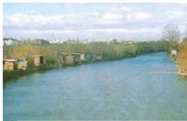
Fluss, welchen der Priester überquerte