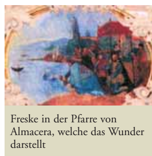
Freske in der Pfarre von Almacera, welche das Wunder darstellt