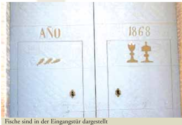
Fische sind in der Eingangstür dargestellt