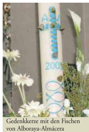
Gedenkerze mit den Fischen von Alboraya-Almácer