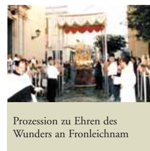
Prozession zu Ehren des Wunders an Fronleichnam