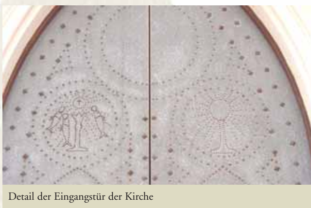
Detail der Eingangstür der Kirche