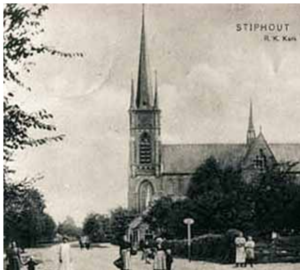
Église Saint-Trudo, Stiphout