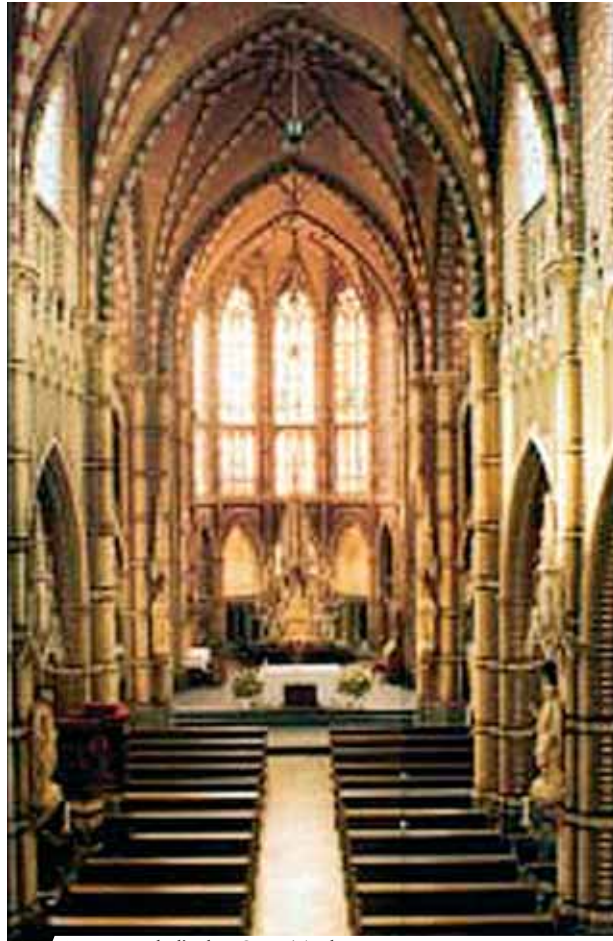
Intérieur de l'église Saint-Trudo

Dans le Miracle Eucharistique de Stiphout, les Hosties consacrées furent préservées d'un violent incendie qui détruisit toute l'église qui fut par la suite reconstruite. De nombreux documents décrivent le Prodige ainsi qu'une peinture où est représenté l'épisode miraculeux que l'on peut admirer dans l'église paroissiale. Cet événement est rappelé chaque année par les citoyens de Stiphout le jour de la Fête-Dieu.