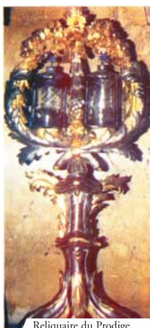
Reliquaire du Prodigé