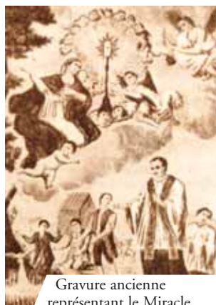
Gravure ancienne représentant le Miracle