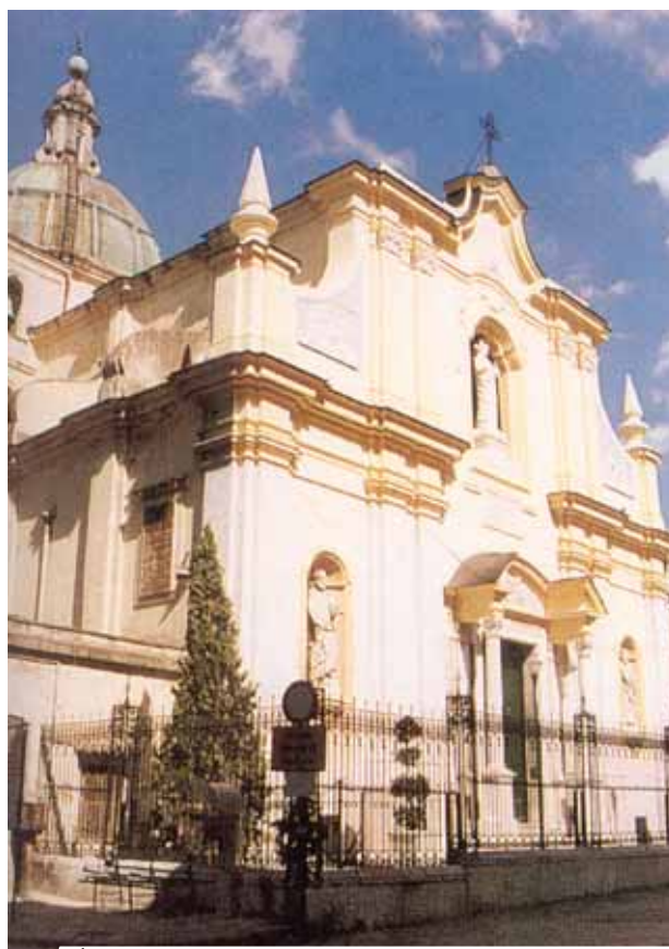
Église Saint-Pierre, Patierno

Le 29 août 1774, la Curie de l'Archevêché exprima un avis favorable sur le retournement miraculeux et l'inexplicable conservation des Hosties soustraites de l'église Saint-Pierre à Patierno le 24 février 1772. En 1971 a été proclamé l'Année Eucharistique du diocèse afin de faire prendre conscience du Miracle Eucharistique à la communauté du diocèse. Malheureusement en 1978 des voleurs ont réussi à s'emparer même du Reliquaire avec les Particules Miraculeuses de 1772.