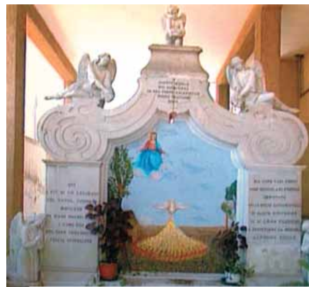
Pierre tombale érigée à l'endroit où furent trouvées les Hosties