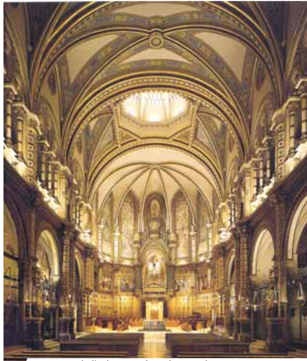
Intérieur de l'église où advint le Miracle

Ce Prodige Eucharistique nous est transmis par le Père Bénédictin R.P. Francio de Paula Crusellas, dans son texte Nueva historia del Santuario y Monasterio de Nuestra Senora di Montserrat .