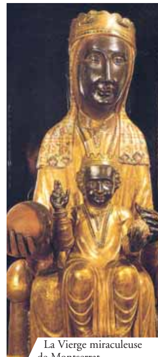
La Vierge miraculeuse de Montserrat