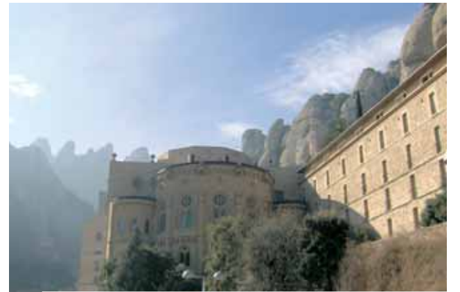
Sanctuaire de la Vierge de Montserrat