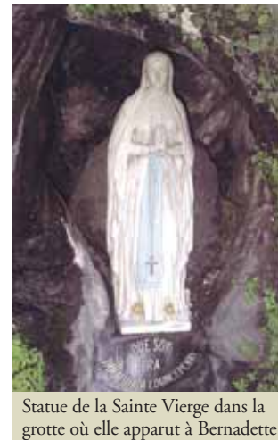
Statue de la Sainte Vierge dans la grotte où elle apparut à Bernadette