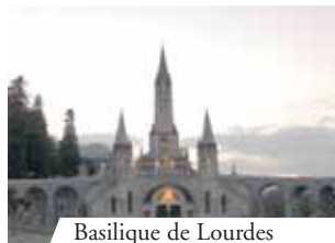
Basilique de Lourdes

En 1888 un prêtre français du Pèlerinage National proposa de faire une procession avec le Très Saint Sacrement à Lourdes. C'est alors que se produisit une guérison miraculeuse. Depuis ce jour les malades qui vont à Lourdes en pèlerinage sont bénits avec le Très Saint Sacrement et d'innombrables guérisons se sont manifestées à son passage. Le Sanctuaire de Lourdes est un exemple lumineux de la foi dans la présence réelle de Jésus dans l'Eucharistie.