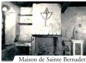
Maison de Sainte Bernadette