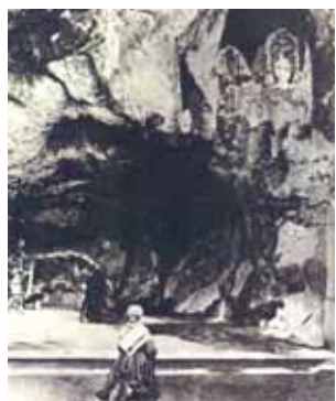
Une des plus anciennes photographies de Bernadette à la grotte (1864)