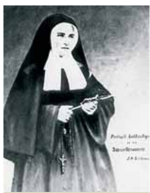
Sainte Bernadette décida de devenir religieuse et entra au couvent des Sœurs de la Charité à Nevers