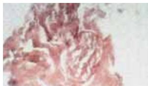
Un nerf vague