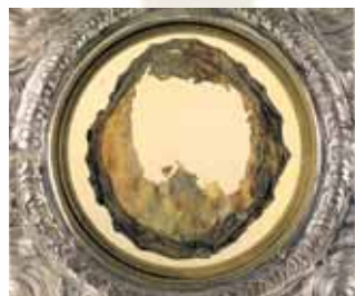
La Chair fait partie du myocarde et précisément du ventricule gauche. On identifie bien les vaisseaux des artères et des veines, ainsi qu'un double et mince fragment du nerf vague. Au moment du Miracle la chair était vive, puis elle a suivi la loi du rigor mortis .