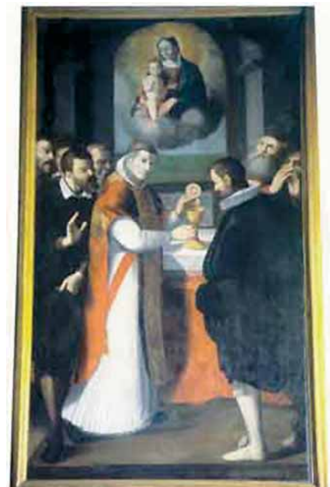
Tableau ancien représentant le Miracle