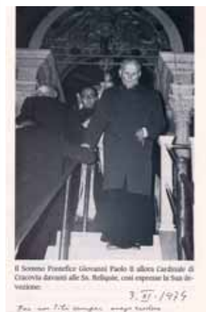
Il Sommo Pontefice Giovanni Paolo II allora Cardinale di Cracovia davanti alle Ss. Reliquie, così espresse la sua impressione: 3.27.1979