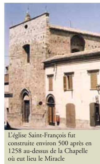
L'église Saint-François fut construite environ 500 après en 1258 au-dessus de la Chapelle où eut lieu le Miracle