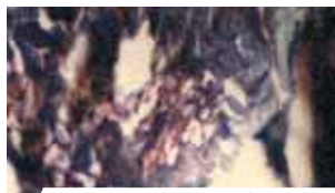
Fragment de tissu adipeux