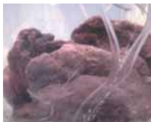
Les cinq caillots de sang vus à la loupe. Dans le Sang du Prodige, on retrouve tous les composants présents dans le sang frais. Et, miracle dans le miracle, chacun des cinq caillots de Sang pèse séparément 15,85 grammes : ce qui est le poids exact de tous les cinq caillots pesés ensemble !