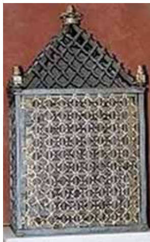
Grille en forme de cube en fer forgé doré où furent conservées les Reliques pendant environ 266 ans.