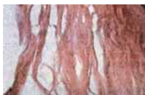
Aperçu histologique de la Chair.