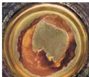
Le Miracle fut l'objet de plusieurs vérifications de la part des Autorités de l'Église, entre 1574 et 1886. En 1970 il fut soumis à un examen scientifique de la part des professeurs de l'Université de Sienne qui conclurent : « La Chair est de la véritable chair humaine (composée par un tissu musculaire du cœur); le sang est du vrai sang (appartenant au même groupe sanguin AB que la chair); les substances sont celles du tissu humain, normales et fraîches: la conservation de la chair et du sang, laissés à l'état naturel pendant douze siècles et exposés à l'action des agents atmosphériques et biologiques, reste un phénomène extraordinaire.» Relation Linoli 41311971