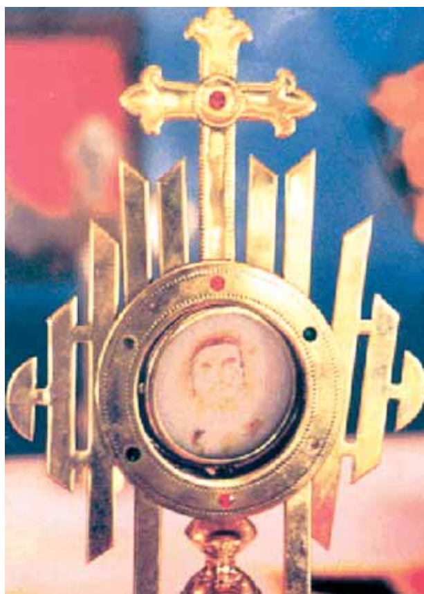
L'ostensoir contenant l'Hostie sur laquelle le visage est apparu