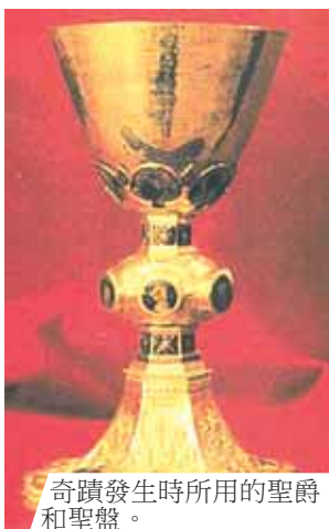
奇蹟發生時所用的聖爵和聖盤。