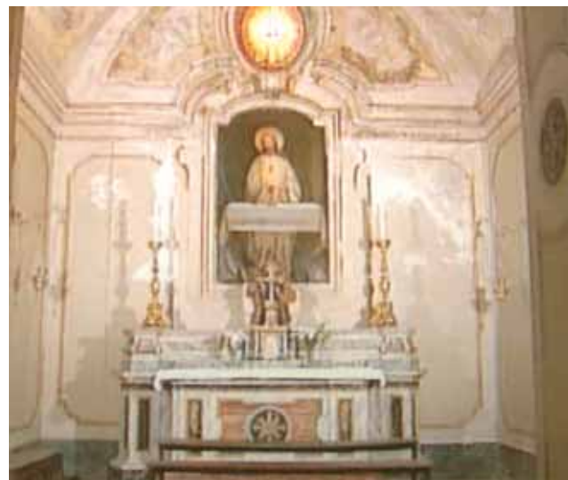
奇蹟即發生在這座聖堂裡。

1570年的復活節，聖埃拉斯本堂依照傳統，將聖體放在銀色圓形的聖體盒中，以形似聖囊之物為蓋子，然後放入大形銀製聖爵中，再蓋上聖盤。外邊罩上珍貴優雅的絲質布衫。值得一提的是，即使經過1452年的科隆會議 (Council of Cologne)，明供聖體在十五世紀時還不是很普遍。依照慣例，城裡每個善會前往拜聖體一個小時。「上主憐憫善會」（前身為基督聖體及聖母善會）也登記了。他們穿著黑大衣，每個人都跪著祈禱。當一份記載這個聖體奇蹟最具公信力的文