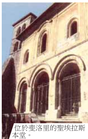
位於斐洛里的聖埃拉斯本堂。