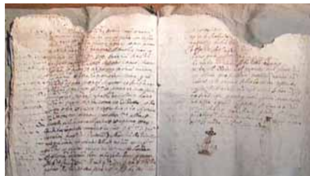
文件中記錄著奇蹟發生時現場目擊證人的證詞，以及他的誓詞。