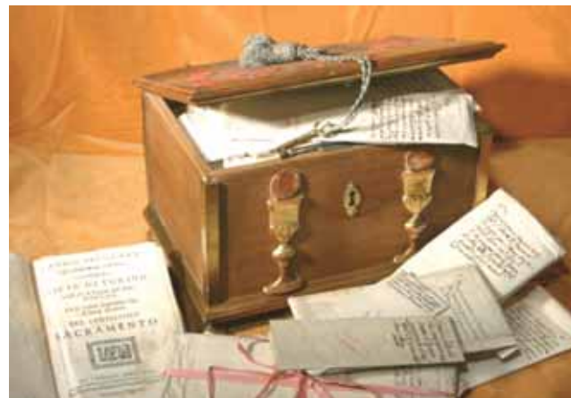
這個盒子是1672年時用杜林市產的檜木製成，用以存放聖體奇蹟的文件。