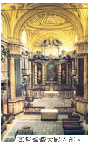
基督聖體大殿內部。