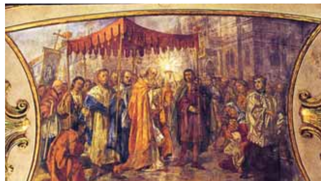
大殿拱門上的壁畫，描繪聖蹟經過，由畫家Luigi Vacca於1853繪。