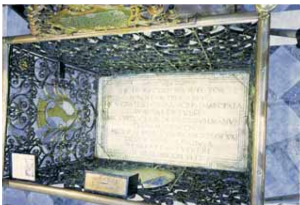
騾子跌倒處的碑文。