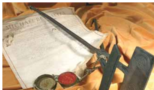
發生奇蹟的聖體已在鐵上烙下聖痕。杜林市歷史檔案中記載，這塊鐵已於1673年由Exilles城運送至杜林市，並於1684年轉送給市政府保存一直到今天。

這幅畫名為《祝聖聖體的奇蹟》，由不知名人士所繪，描述的是1453年6月6日晚上約8時，發生在榮耀的杜林市中的聖蹟(畫作收藏編號Simeom C 2412)。這幅三折畫要突出聖蹟的三個主要部分：Exilles城中的聖體被偷了、騾子跌倒，聖體飛升天、聖體降下在聖爵中。兩個門柱上並掛有象徵杜林市的紋章。