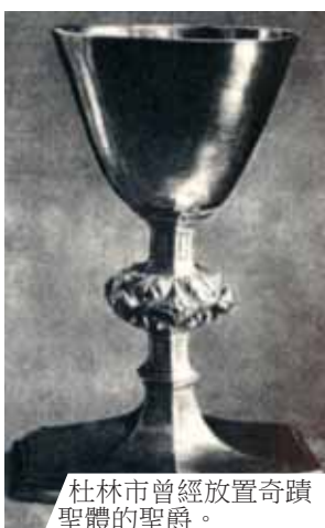
杜林市曾經放置奇蹟聖體的聖爵。