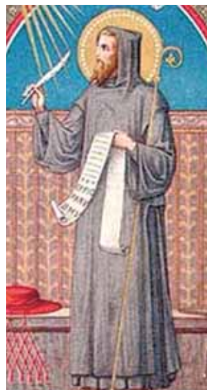
教宗聖額我略的聖像