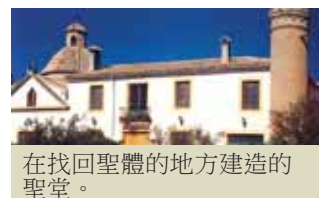
在找回聖體的地方建造的聖堂。