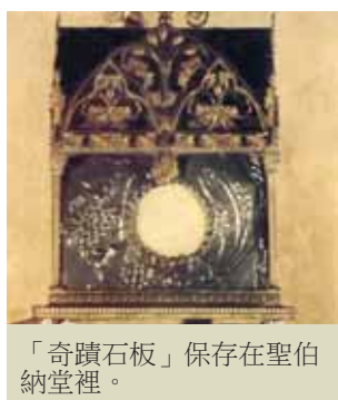
「奇蹟石板」保存在聖伯納堂裡。