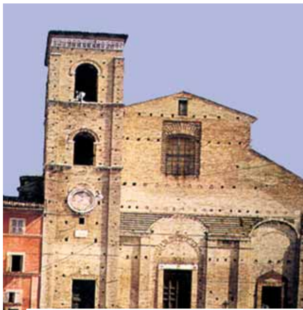
馬切拉塔主教座堂。

1356年4月25日，在馬切拉塔，一位不知名的神父在本篤會的聖加大利納堂舉行感恩聖祭。在擘餅後，領聖體前，神父開始懷疑是否耶穌真正親臨祝聖的聖體中。擘餅時，因為過於擔憂，他看到一股血由聖體噴出，沾染了放在祭台上的九摺布和聖爵。