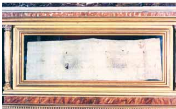
沾了聖血的九摺布。