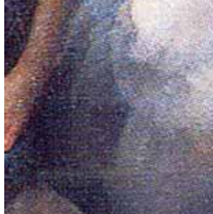
聖達義由天使手中領受聖體（現存於米蘭教區博物館）。