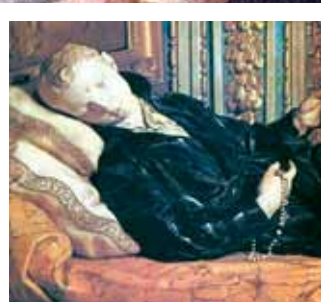
聖達義之墳，位於羅馬Quirinale的聖安德堂。