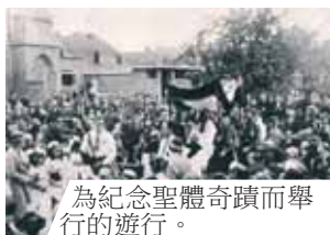
為紀念聖體奇蹟而舉行的遊行。