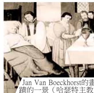
Jan Van Boeckhorst的畫，描繪的是發生奇蹟的一景 (哈瑟特主教座堂)。