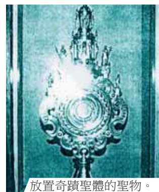
放置奇蹟聖體的聖物。

1317年7月25日，有人請Viversel的本堂神父去為一位患重病的教友送聖體。一到病人家，神父將袋子隨手放在入門的桌子上，袋子裡有一個裝了聖體的聖體盒，然後就進去聽告解。這一家裡有一個人被這個袋子吸引。他趁沒人注意時打開袋子，拿出聖體盒，掀開盒蓋，伸手進去。當他發現是一塊聖體時，就立刻放回袋裡。之後，神父走出病人的房間，準備拿聖體送給病人。他由袋子裡拿出聖體盒，當他打開盒蓋時，赫然發現他之前在彌撒時所祝聖的聖體，居然沾了