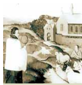
哈瑟特的聖康坦主教座堂內的一幅畫。畫中描繪在稱為「Sacramentsberg」(「聖體」)的地方，一群羊跪在神父經過的路旁，神父手中捧著聖物。