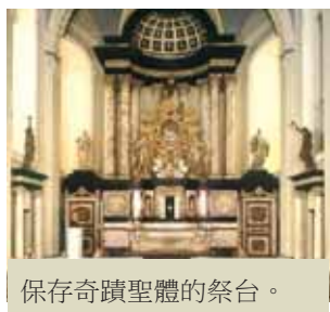
保存奇蹟聖體的祭台。