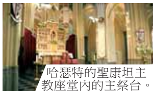
哈瑟特的聖康坦主教座堂內的主祭台。