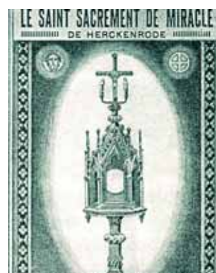
用來放置奇蹟聖體的聖體光。