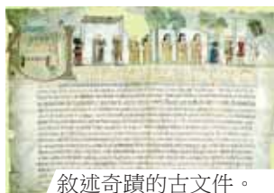
敘述奇蹟的古文件。