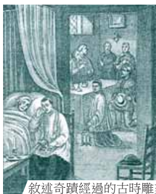
敘述奇蹟經過的古時雕刻。