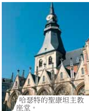
哈瑟特的聖康坦主教座堂。

在哈瑟特的聖康坦 (Saint-Quentin) 主教座堂擺放著1317年發生在赫肯若的聖體奇蹟。歷經幾個世代，許多調查結果均證實所保存的聖體曾經湧出聖血，例如十八世紀時，古奧地利大公夫人Isabelle來訪時，由教廷大使Carafa、列日 (Liège) 主教、馬林 (Malines) 總主教所執行的調查。