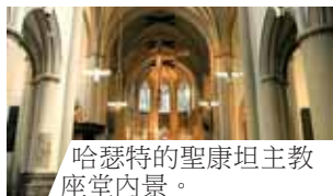
哈瑟特的聖康坦主教座堂內景。