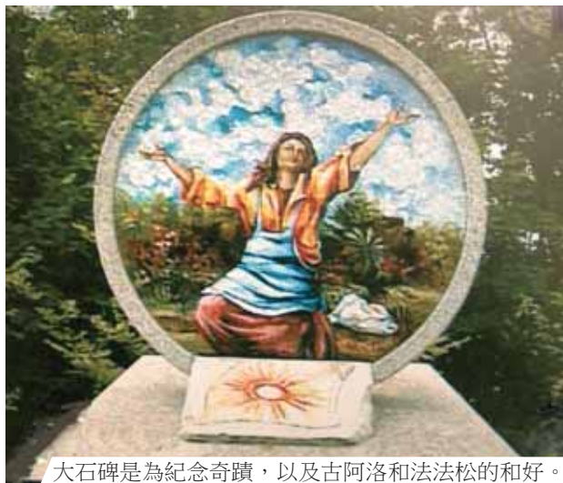
大石碑是為紀念奇蹟，以及古阿洛和法法松的和好。