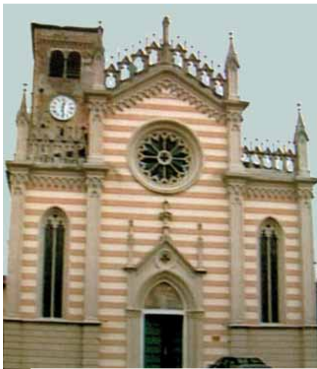
沾了聖血的布保存在法法松的基督聖體堂。

眾多教會官方文件記載了關於發生在古阿洛的聖體奇蹟，其中一份是由歷史學家Antonio Nicoletti (1765) 所寫的。一位婦人在Versiola運河沿岸的洗衣池中洗衣服，突然她看見其中一塊布上沾了血跡，這塊布是聖義堂 (San Giusto) 的祭台布。婦人再仔細端詳，看到血跡是由褶在布裡的一塊聖體流出來。