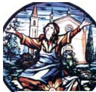
古阿洛教堂裡的花窗，描述奇蹟的發生。