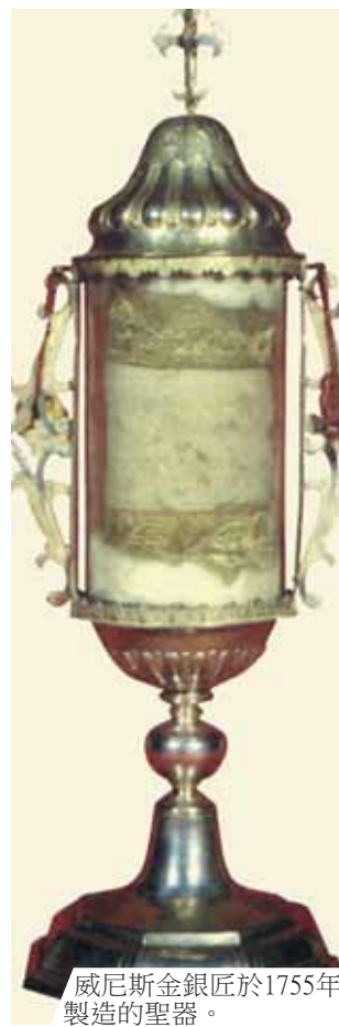
威尼斯金銀匠於1755年製造的聖器。