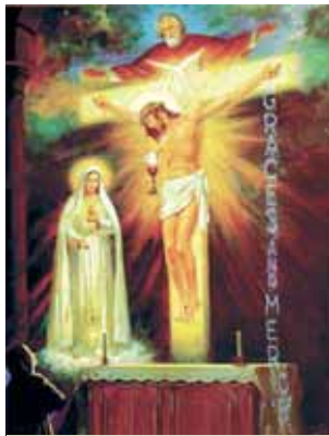
這幅畫中，聖母要求露西亞修女倡導每月首週六敬禮無染原罪聖母聖心。