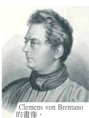
Clemens von Brentano的畫像。