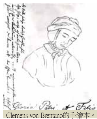
Clemens von Brentano的手繪本。