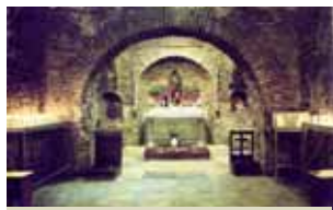
依著安娜加大利納的神視，人們重新找到瑪利亞在厄弗所生活的房子。