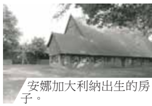
安娜加大利納出生的房子。