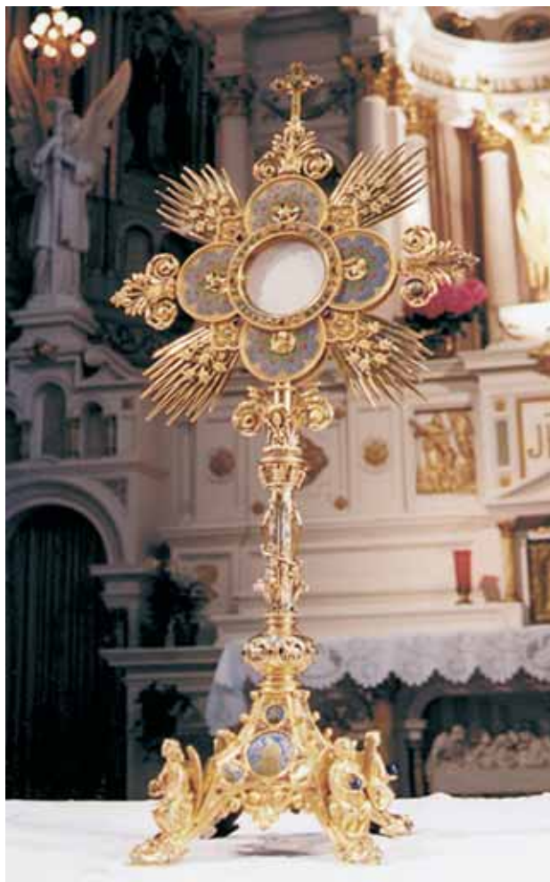
尚保存於列日聖茱利安納堂聖所內的聖體光。

儘管每一天都舉行神聖的彌撒聖祭，我們還是特別會在一年中的這一天，莊嚴隆重地紀念耶穌基督。當然，我們常會以心神祈求耶穌，然耶穌並不真實臨在於這種方式中，而是在紀念基督的感恩聖事裡，祂以真正的實體臨在我們中間。復活的基督在升天前說：「看！我同你們天天在一起，直到今世的終結。」（瑪廿八20）教宗伍朋四世說：「祂將要從世界過去。」（Transiturus De Hoc Mundo）