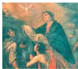
聖塞孔德 (Saint Secondo) 臨終前，領受一塊由鴿子送來的聖體 (Hiéron博物館)。