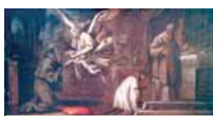
聖文德 (Saint Bonaventur) 由天使手中領受聖體 (Hiéron博物館)。