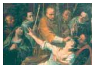
聖納德 (Saint Bernard) 以至聖聖體為一位婦女驅魔 (Hiéron博物館)。