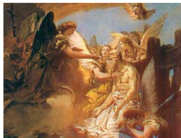
聖羅尼莫 (Saint Jerome) 領受許多次聖體奇蹟，這是其中一次。