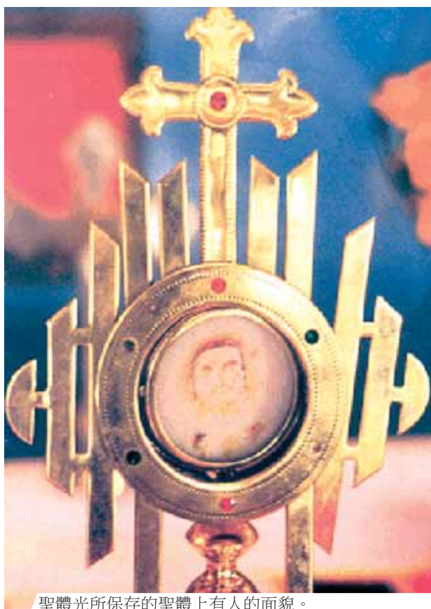
聖體光所保存的聖體上有人的面貌。